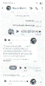
Captura de tela 2026-03-27 143404.png 206K